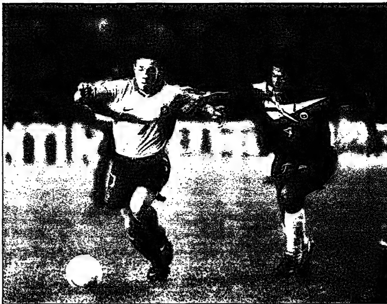
اللاعب التشيلي رونالدو فيرونالدو الى اليسار ينافس جونيلينو لاعب البرازيل على الكرة في المباراة الودية بين الفريقين (دوروثي)